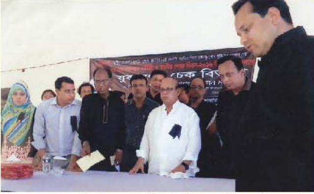
পিরোজপুর জেলার ভাভারিয়া উপজেলায় জাতীয় শোক দিবসে আয়োজিত ঋণ বিতরণ অনুষ্ঠানে প্রধান অতিথি হিসেবে উপস্থিত ছিলেন পরিবেশ ও বন মন্ত্রী আনোয়ার হোসেন মঞ্জু এমপি