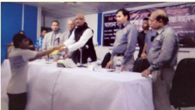
গোপালগঞ্জে জাতীয় শোক দিবসে আয়োজিত অনুষ্ঠানে প্রধান অতিথি যুব ও ক্রীড়া উপমন্ত্রী আরিফ খান জয় এমপি যুবঋণের চেক বিতরণ করছেন

গোপালগঞ্জ জেলার সদর উপজেলায় আলোচনা সভা, যুব ঋণের চেক বিতরণ ও দোয়া মাহফিলের আয়োজন করা হয়। উক্ত অনুষ্ঠানে প্রধান অতিথি হিসেবে উপস্থিত ছিলেন গণপ্রজাতন্ত্রী বাংলাদেশ সরকারের যুব ও ক্রীড়া মন্ত্রণালয়ের দায়িত্বে নিয়োজিত উপমন্ত্রী আরিফ খান জয় এমপি। প্রধান অতিথি তার বক্তব্যে জাতির পিতার রাজনৈতিক জীবন, ভাষা আন্দোলন, পাকিস্তানের কারণগার থেকে দেশে প্রত্যাবর্তনের স্মৃতিচারণ করে বলেন বঙ্গবন্ধুর নেতৃত্বে বঙ্গপ্রতিম আন্তর্জাতিক সম্প্রদায়ের সহযোগিতা নিয়ে সর্বপর্ধ্যয়ে পূর্ণগঠন, যোগাযোগ ব্যবস্থার পূর্ববাহাল, খাদ্যে স্বয়ংসম্পূর্ণতাসহ আইনশৃঙ্খলার উন্নতি সাধনের মাধ্যমে দেশের মানুষ যখন স্বাধীনতার স্বপ্ন উপভোগ করা শুরু করছিল তখনই দেশীয় ও আন্তর্জাতিক চক্রান্তে ১৫ আগস্ট/৭৫ স্ব-পরিবারে শাহাদাতবরণ করতে হয় স্বাধীনতার মহান স্থপতি বাঙালিজাতির হাজার বছরের শ্রেষ্ঠ সন্তান জাতির পিতা বঙ্গবন্ধু শেখ মুজিবুর রহমানকে। (বাকি অংশ ৪র্থ পৃষ্ঠায়)