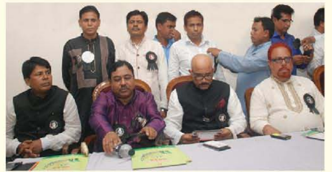
যুব ভবনে জাতীয় শোক দিবসে যুব উন্নয়ন অধিদপ্তর কর্মচারী লীগ কর্তৃক আয়োজিত আলোচনা সভা ও দোয়া মাহুফিলে যুব ও ক্রীড়া মন্ত্রণালয়ের উপমন্ত্রী আরিফ খান জয় এমপি ও জাতীয় শ্রমিক লীগের নেতৃত্ববৃন্দ