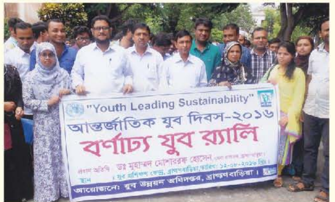
আন্তর্জাতিক যুবদিবস ২০১৬ ব্রাহ্মণবাড়িয়া জেলা কার্যালয় কর্তৃক আয়োজিত বর্ণাঢ্য যুব র্যালীর একাংশ

বিদেশ যেতে চান? প্রশিক্ষণ নিয়ে দক্ষ কর্মী হিসেবে বৈধ পথে যান।