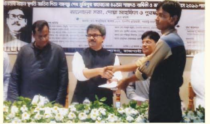
রাজশাহীতে জাতীয় শোক দিবসে আয়োজিত ঋণ বিতরণ করছেন প্রধান অতিথি পররাষ্ট্র প্রতিমন্ত্রী মোঃ শাহরিয়ার আলম এমপি