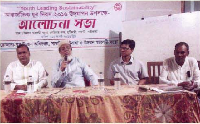
সাঘাটা, গাইবান্ধার আন্তর্জাতিক যুবদিবসে বক্তব্য রাখছেন ডেপুটি স্পিকার মোঃ ফজলে রাকিব মিয়া এমপি