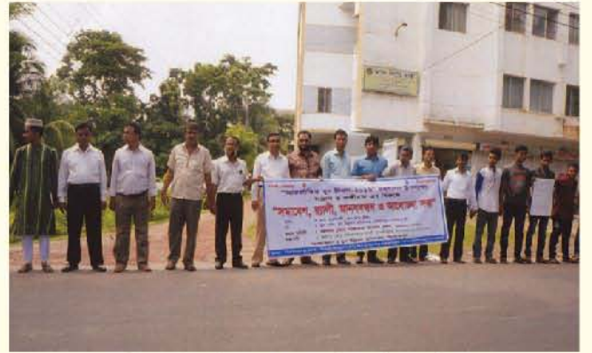
আন্তর্জাতিক যুবদিবসে পিরোজপুর জেলা কার্যালয় কর্তৃক যুব র্যালীর একাংশ

যে দেশে যেতে চান সে দেশের ভাষা ও আইন কানুন জেনে নিন।