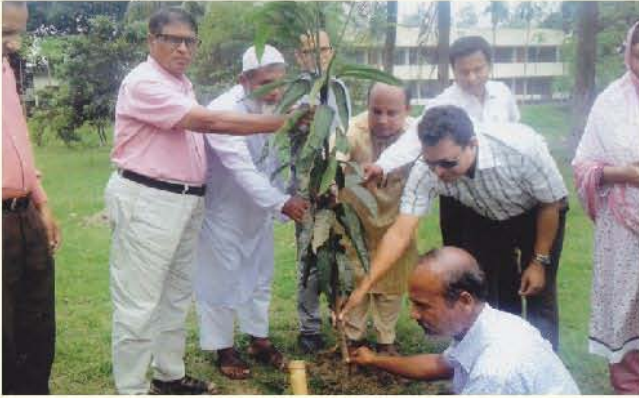
সিরাজগঞ্জ জেলা কর্তৃক আয়োজিত আন্তর্জাতিক যুবদিবস ২০১৬ উপলক্ষে বৃক্ষরোপন