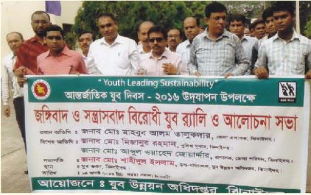
আন্তর্জাতিক যুবদিবসে বিনাইদহ জেলা কর্তৃক আয়োজিত যুব র্যালী