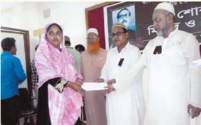
কুড়িগ্রাম জেলায় জাতীয় শোক দিবসে যুব ঋণের চেক বিতরণ অনুষ্ঠান